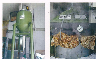
30年間がんばっています！

最近のハプニングは、なんとけん化缶の温度が上がらなくなりました。石けん工場なのに石けんが作れなくなったら大変です。私たちだけでは手に負えず機械を見ていただくことになりましたが、けん化缶の中の残りの石けん生地をすべて出さなければなりません。おおよそ200キロ……。石けんだらけになりながら、生地を出し修理完了、一件落着。