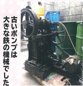
古いポンプは 大きな鉄の 機械でした

いつもと趣向を変えて、今回は工場の設備をお見せします。石けんを作るのに大切なプランジャーポンプ。長年頑張ってくれていましたが、昨年とうとう新しいものに買い替えとなりました。