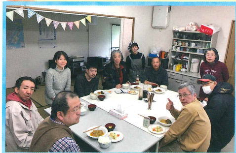
みんなが集まって食べると さらにおいしい気がする!

サボン草での、メンバーの誕生会の様子です。その月に誕生日のメンバーが、食べたいものをリクエスト！おいしそうでしょう？