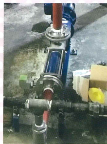
新しいポンプは コンパクトで 現代風!